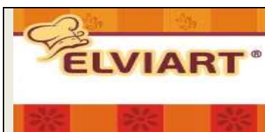
Η ELVIART ABEE

Τα οικοτροφεία μας υποστήριξαν με τα προϊόντα τους οι: