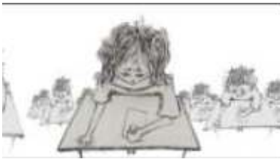
Wara , 3' (Lebanon) 2008 Σκηνοθεσία: Sarah Stage, Παραγωγή: ALBA

Σε μια πόλη που τα όνειρα και η ποίηση είναι από χαρτί, μια πλαστική σακούλα ξεφεύγει με τον άνεμο προς ένα μικρό κορίτσι. Αλλά τι πρέπει να πει κανείς για μια πόλη όπου τα παιδιά πρέπει να σβήνουν τις ζωγραφιές τους; Επιλογή του Φεστιβάλ Corto Del MED