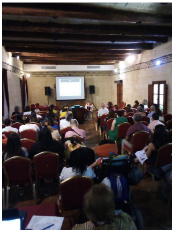
Rhoda Garland – CRPD