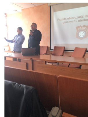
Σύλλογος Κωφών RES-GEST